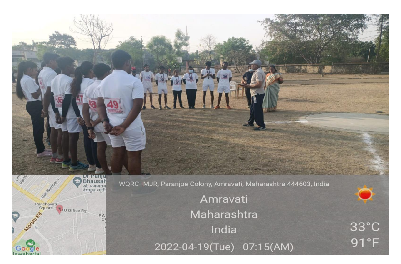
Athletic coaching 2018