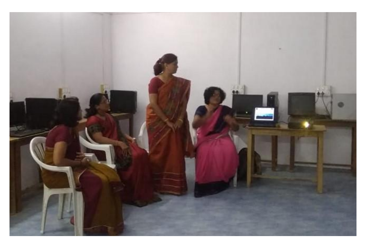
Research Methodology Lectures 2019