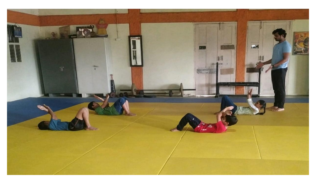
Jodo Coaching 2018