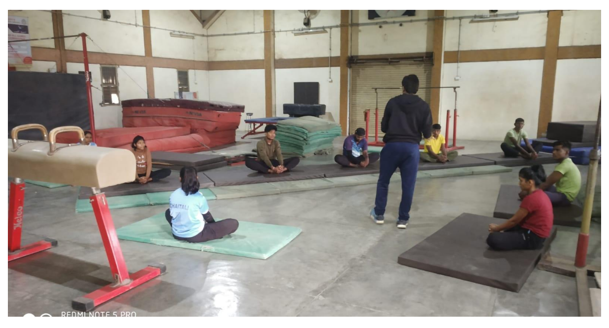
Gymnastic coaching 2017